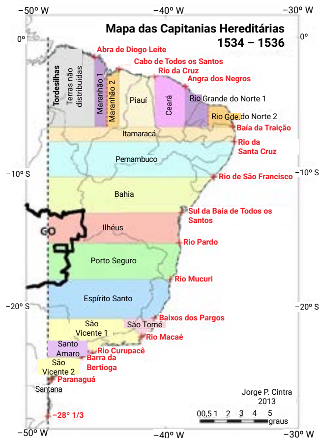
Novo mapa das capitanias.

Entre as capitanias estabelecidas, destacava-se a capitania de Pernambuco, onde se situava o atual território de Alagoas. Quando comparada a outras capitanias, Pernambuco apresentou um significativo desenvolvimento econômico e urbano. A região correspondente ao atual estado de Alagoas localizava-se na porção sul dessa capitania.