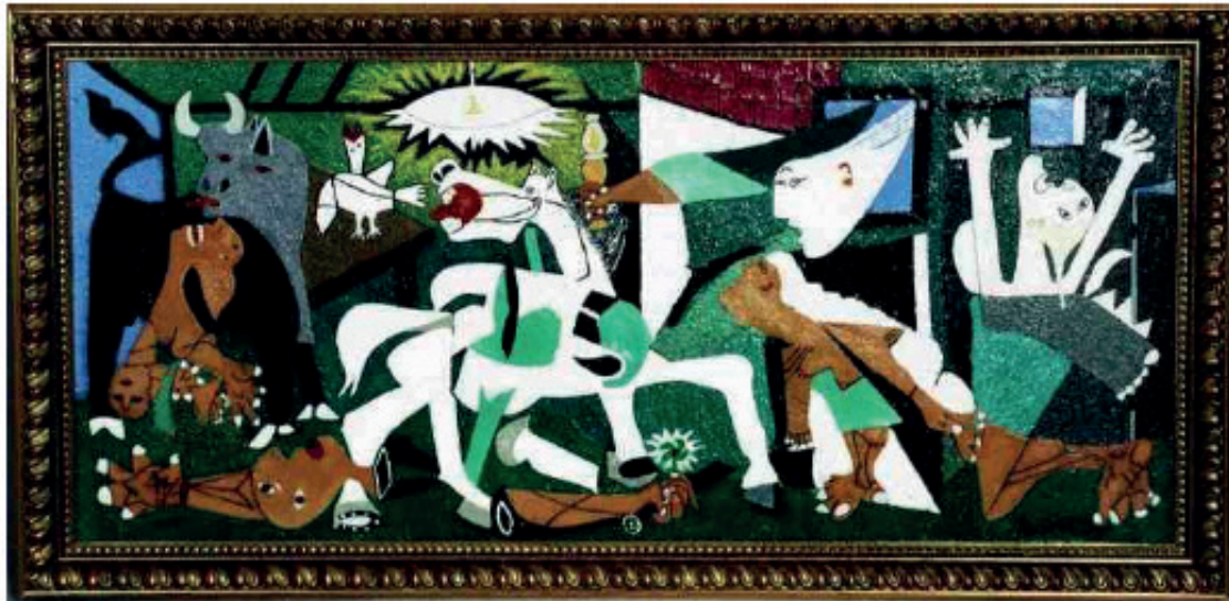
Figura 1 – Guernica - Pablo Picasso 3